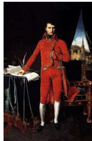
Napoléon Bonaparte dans son habit de consul (d'abord 1 er Premier Consul puis Consul à vie)