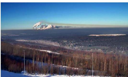
La centrale polonaise vue depuis la piste de ski artificielle