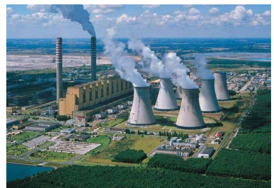
Centrale de Belchatów (en Pologne)

Le terril de déchets (colline artificielle qui accumule les "sous-produits" du minerai de charbon) est tellement grand qu'on y a installé une piste de ski .