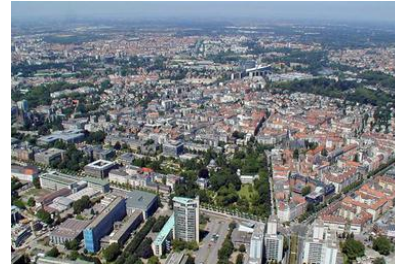
Strasbourg (271 708 hab), grande ville d'Alsace