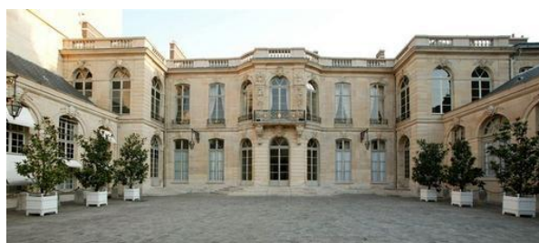
Hôtel Matignon, lieu de travail du 1er ministre, Paris