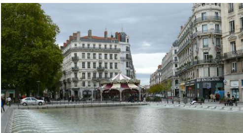
Immeubles anciens, rue de la République, LYON

On trouve de beaux immeubles (dont un grand nombre datent du XIX ème siècle ) dans les quartiers anciens des grandes villes. Ils sont en principe habités par des familles aisées qui peuvent se permettre de payer des loyers élevés .