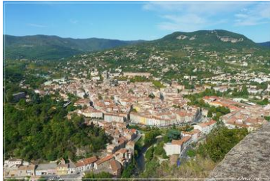
Lodève (7 345 hab), petite ville de l'Hérault

En France, une ville se définit par une population d'au moins 2000 habitants , dont les habitations se présentent sous forme de bâti continu ( pas de coupure de plus de 200 mètres entre deux constructions).