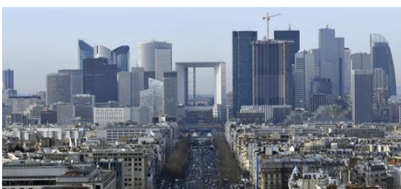
Quartier d'affaires de La Défense

L'agglomération parisienne représente une part très importante de l'activité de la France.